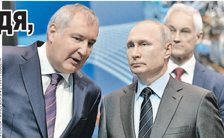
Дмитрий Рогозин (слева) рассказал Владимиру Путину, что андроид в будущем может полететь к Луне.