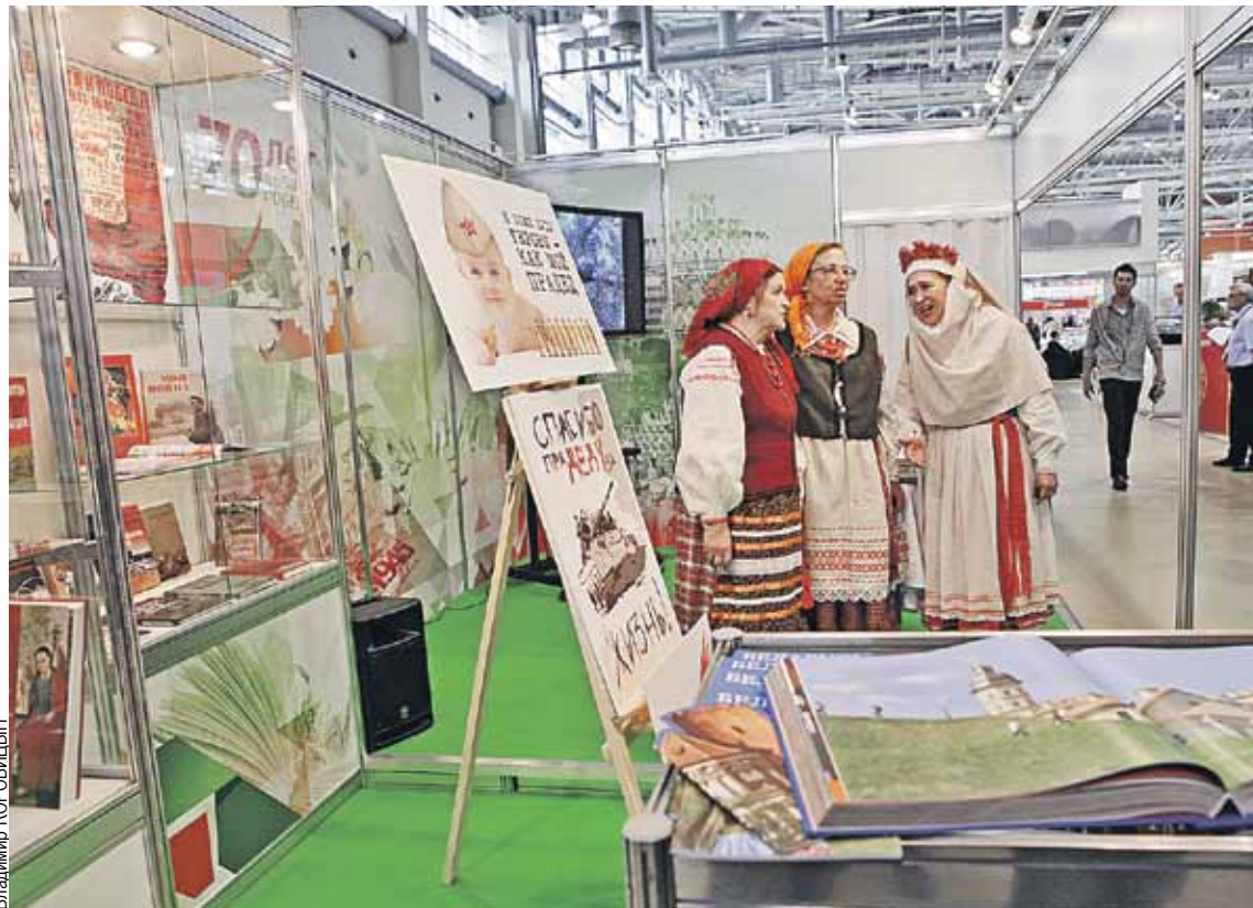
В павильоне можно было и книги купить, и песни послушать.

Экспозиция белорусского стенда была приурочена к 70-летию Великой Победы. Посетителям предлагали самую яркую книгу о войне - «От парада Надежды до парада Победы» издательства «Белорусская энциклопедия имени П. Бровки».