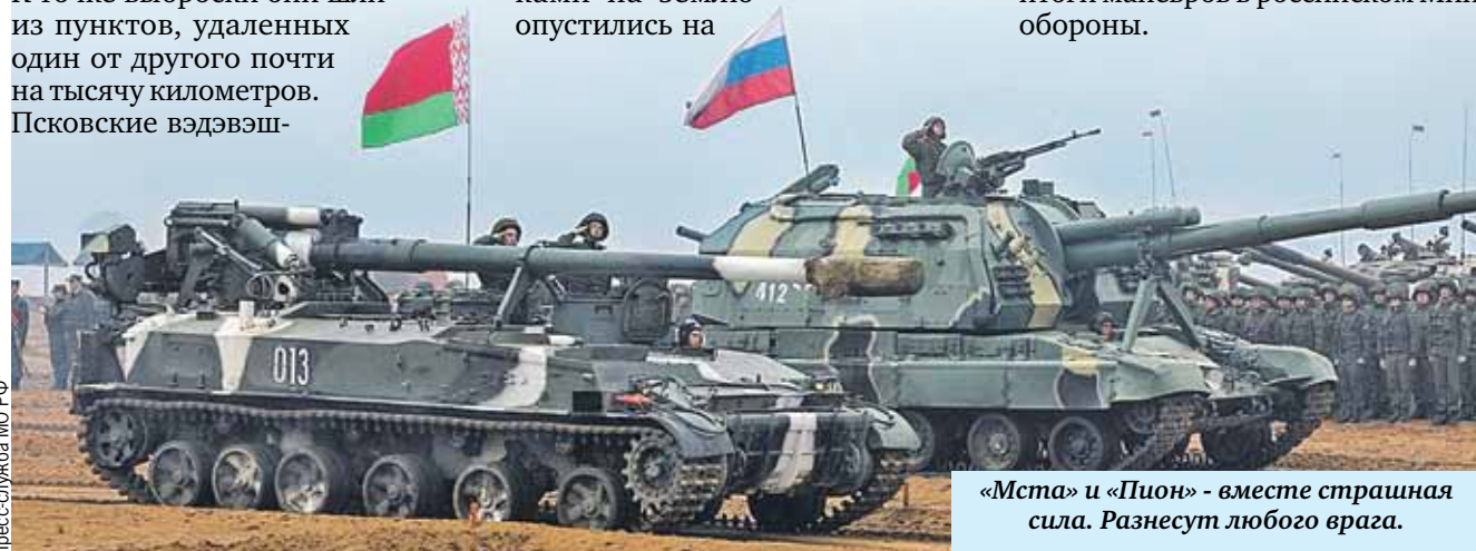
«Мста» и «Пион» - вместе страшная сила. Разнесут любого врага.

- Учения «Запад-2021» еще раз показали, что мы можем в короткие сроки создавать мощные совместные группировки, чтобы пресечь любую агрессию. Решительным ударом образумить и отрезвить врага, который посягает на наши общие границы, на мир и спокойствие наших граждан, - подвели итоги маневров в российском Минобороны.