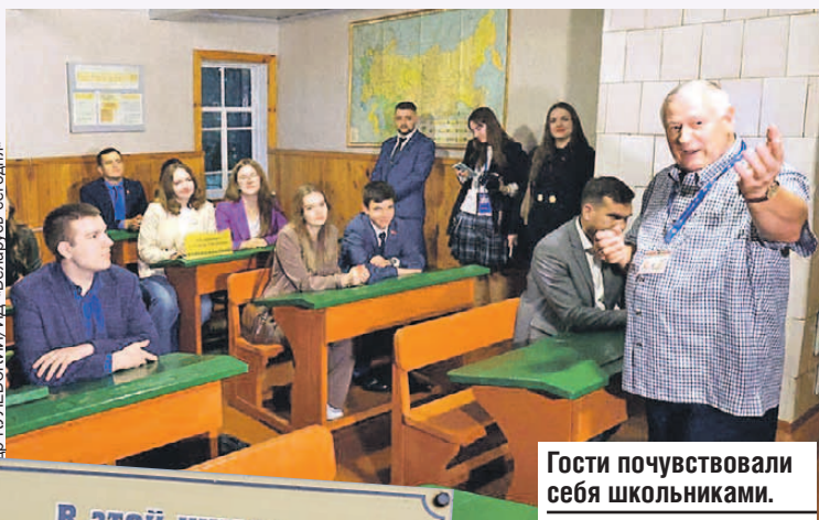
Гости почувствовали себя школьниками.

В этой школе в период с 1961 по 1971 годы учился первый Президент Республики Беларусь Лукашенко Александр Григорьевич