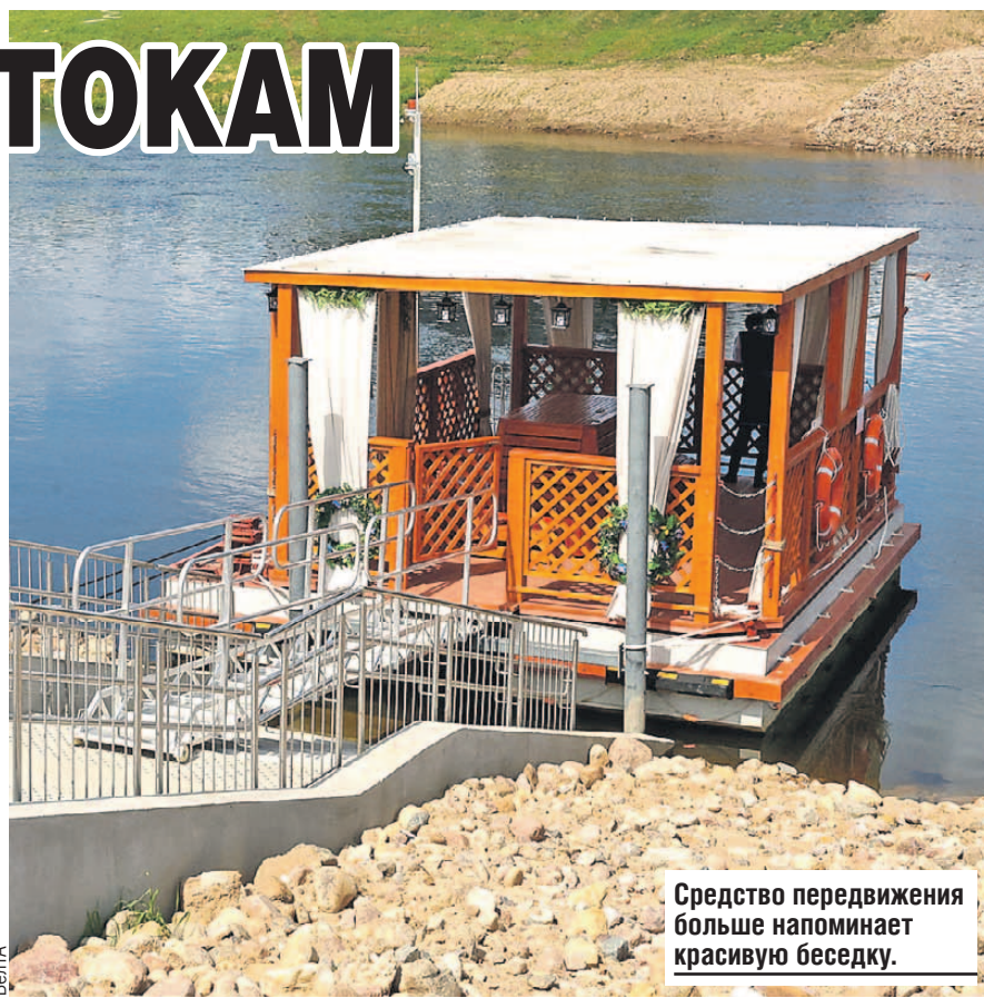
Средство передвижения больше напоминает красивую беседку.

рию, то народ повторяет ошибки заново. В белорусской истории есть горькие страницы: польская оккупация, затем годы Великой Отечественной войны. И сегодня мы видим, что происходит во всем мире. Видим, что происходит на Украине, где забыли свою историю, каким образом переписывают свою историю европейские народы. Они строили памятники советскому солдату-освободителю, а сейчас их рушат. Сохранение исторической памяти внесено в Конституцию Беларуси. И сегодня мы понимаем, что это один из самых важных законодательных шагов. Передать реальную историю - задача для будущего поколения.