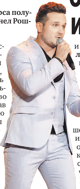
МФИ «Славянский базар в Витебске»

Первую победу Румынии принес певец-молдаванин.