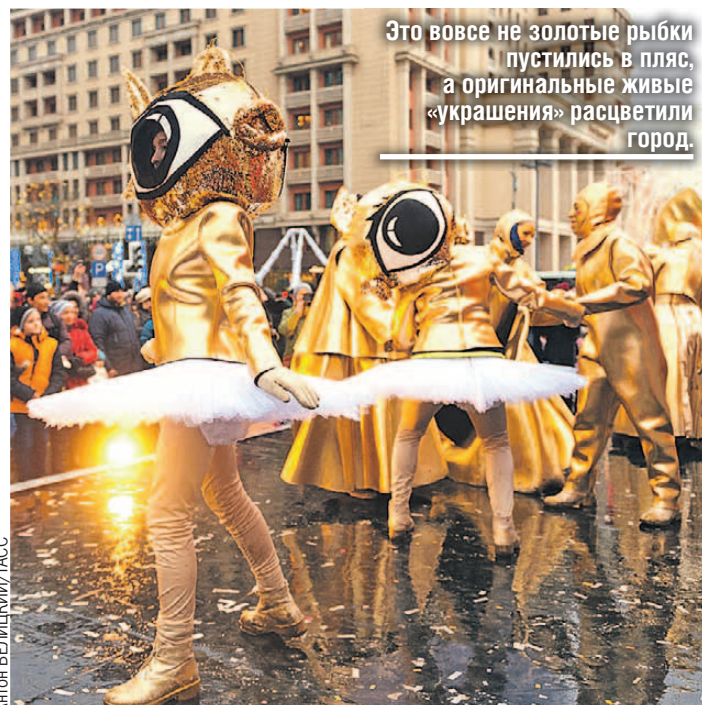
Это вовсе не золотые рыбки пустились в пляс, а оригинальные живые «украшения» расцвели город.

А вы знали, что новогодние деревья могут быть fashion-объектами? Особенно в том случае, если над ними потрудились известные дизайнеры. Да-да, когда за дело берутся мастера иголок и ниток, они и елки-иголки превратят во что-то модное и необычное. На Кузнецком мосту хвойных красавиц к празднику украсят Игорь Чапурин, Алена Ахмадулина, Валентин Юдашкин и другие российские кутюрье.