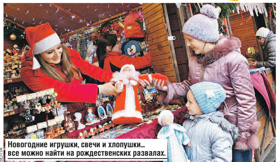
Новогодние игрушки, свечи и хлопушки... все можно найти на рождественских развалах.