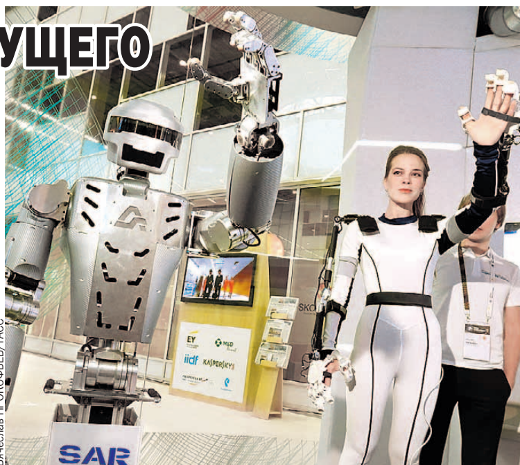
На куратора обещают выучить за полгода - год. А если понравится, можно и углубиться в тему - кодинг, робототехника, искусственный интеллект...

Профстандарт «Цифровой куратор» разрабатывали вместе со специалистами из МГПУ, МИФИ, МИСИС, Института ЮНЕСКО по инфор-