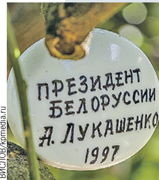
Эти таблички с веток не снимают.

Побывал в саду и тогдашний Председатель Верховного Совета Беларуси Мечислав Грыб. Прививки на знаменитое дерево не делал, зато посадил липу. И тоже оставил запись в главной книге музея: «Если дружат между собой отдельные люди - это хорошо, если народы - это чудесно. И пусть вечно живет дерево Дружбы и дружба между народами всего мира!»