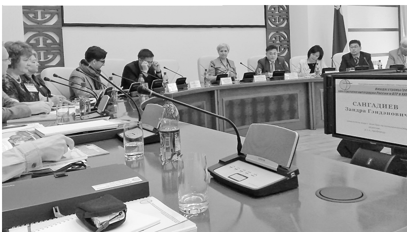
Пленарное заседание конференции

В конце июня газета The Washington Post сообщила, что несколько американских конгрессменов раскритиковали планы Пентагона приобрести десять российских вертолетов Ми-17 для ВВС Афганистана и потребовали закупить машины американского производства. В Пентагоне, однако, подчеркнули, что Ми-17 лучше других подходит для афганских ВВС. Для местных летчиков он, как автомат Калашникова, прост и надежен. Газета напомнила, что США уже истратили 648 млн долл. на ремонт и закупку 31 Ми-17, которые используются афганскими ВВС. Закупка еще десяти планируется на 2011 год. Кроме того, восемь Ми-17 американцы купили для Ирака, 14 – для Пакистана. Что особенно примечательно, Объединенное командование спецопераций ВС США намерено приобрести несколько вертолетов для себя, чтобы использовать их для секретных операций.