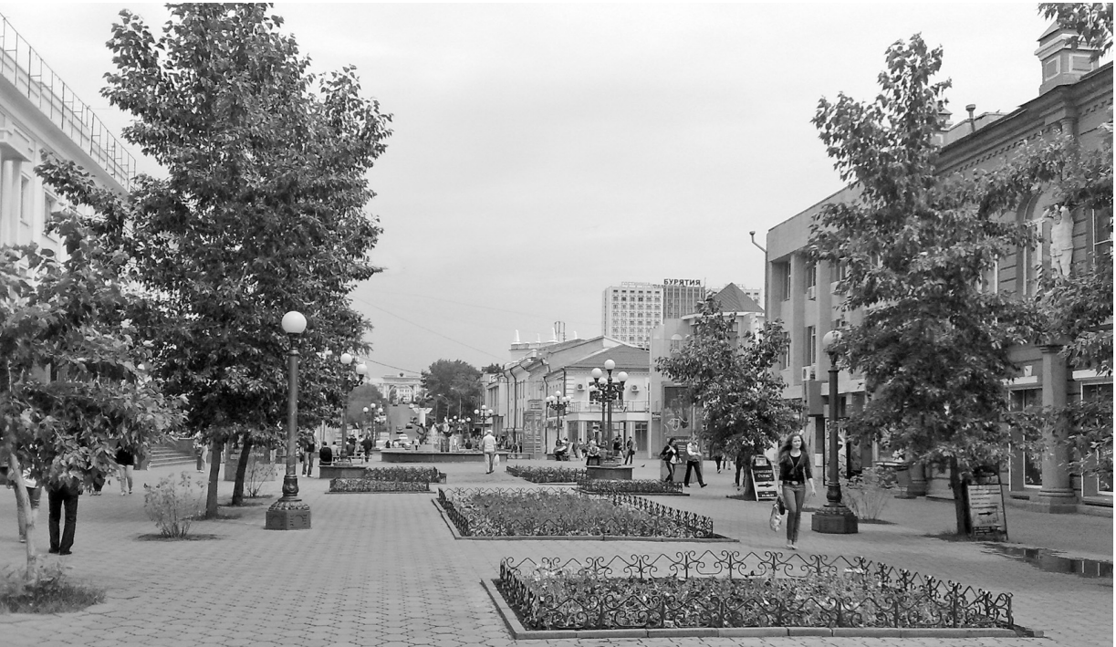
Пешеходная улица в Улан-Удэ