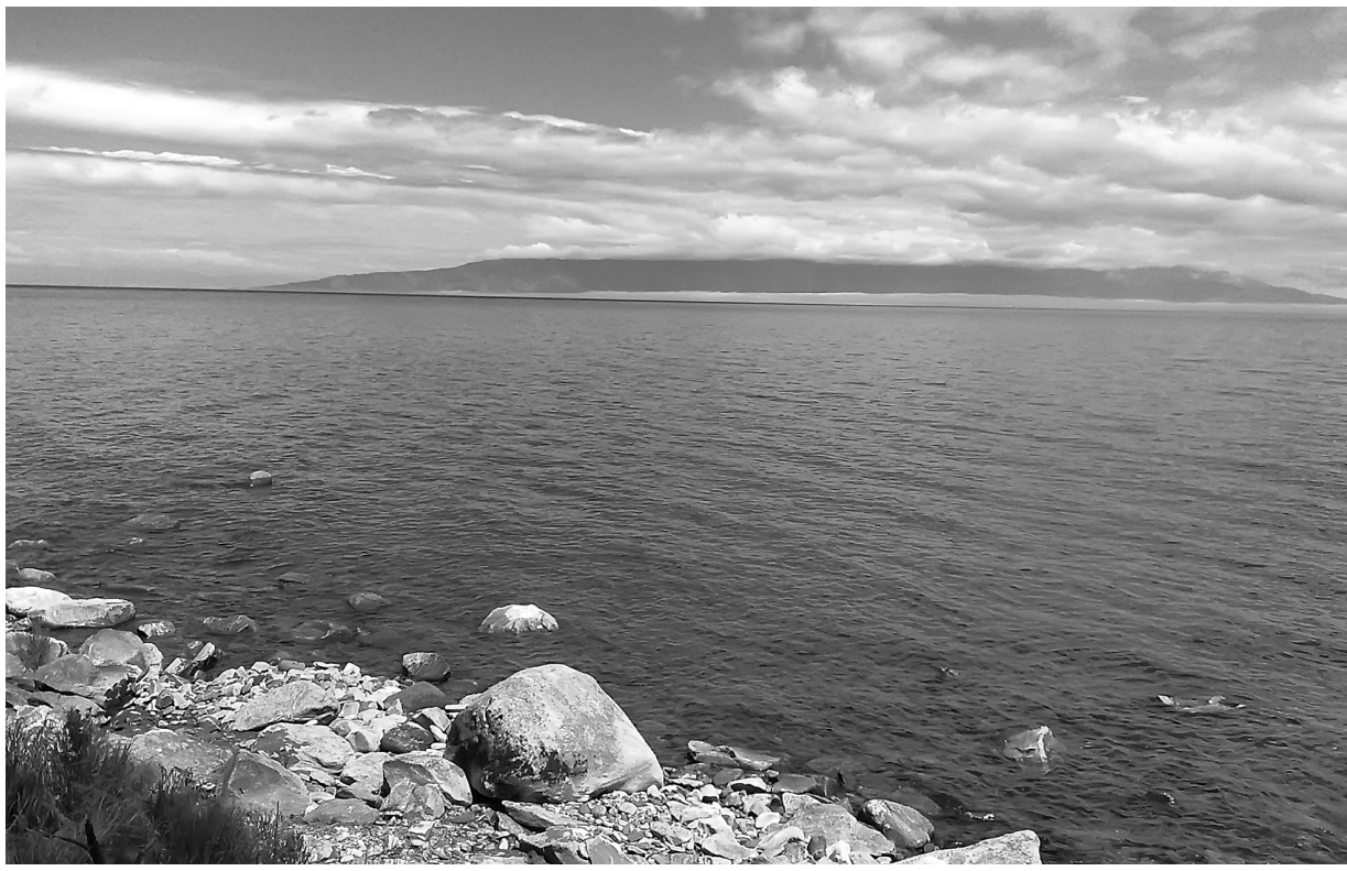
Байкал. Баргузинский залив

Возможно, именно поэтому межнациональные отношения в республике производят впечатление чуть ли не идиллических. Население представляет собой своеобразный русско-бурятский синтез, сама республика – удивительную «русскую Азию». В следующем году Бурятия будет отмечать 350-летие вхождения в состав России. Официально оно произошло при Петре I, но контакты между казаками-землепроходцами и бурятами начались значительно раньше. В частности, город Верхнеудинск был основан в 1666 году (переименован в Улан-Удэ в 1934 г.). Хотя сначала между казаками и бурятами имели место вооруженные столкновения, достаточно быстро буряты увидели в русских союзников против маньчжурско-китайской Цинской империи. Впоследствии буряты служили в составе Забайкальского казачьего войска, а также Селенгинского пешотного полка, который прошел через всю войну 1812 года (включая Смоленское и Бородинское сражения), а затем дошел до Франции. Еще более прославился Селенгинский полк во время обороны Севастополя в 1854-1855 годах. А в начале XX века военнотрудовые бурятской национальности были российскими военными инструкторами в армии Тибета, который в тот период был независим от Китая и актив-