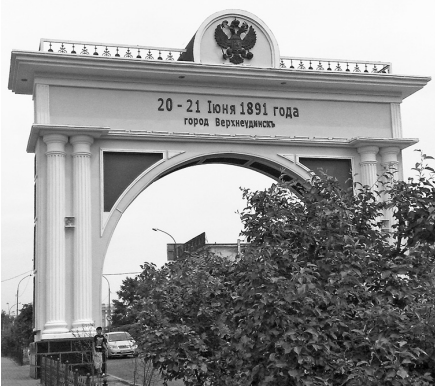
Арка «Царские ворота в Улан-Удэ»

Республика на берегу Байкала в поисках имиджа