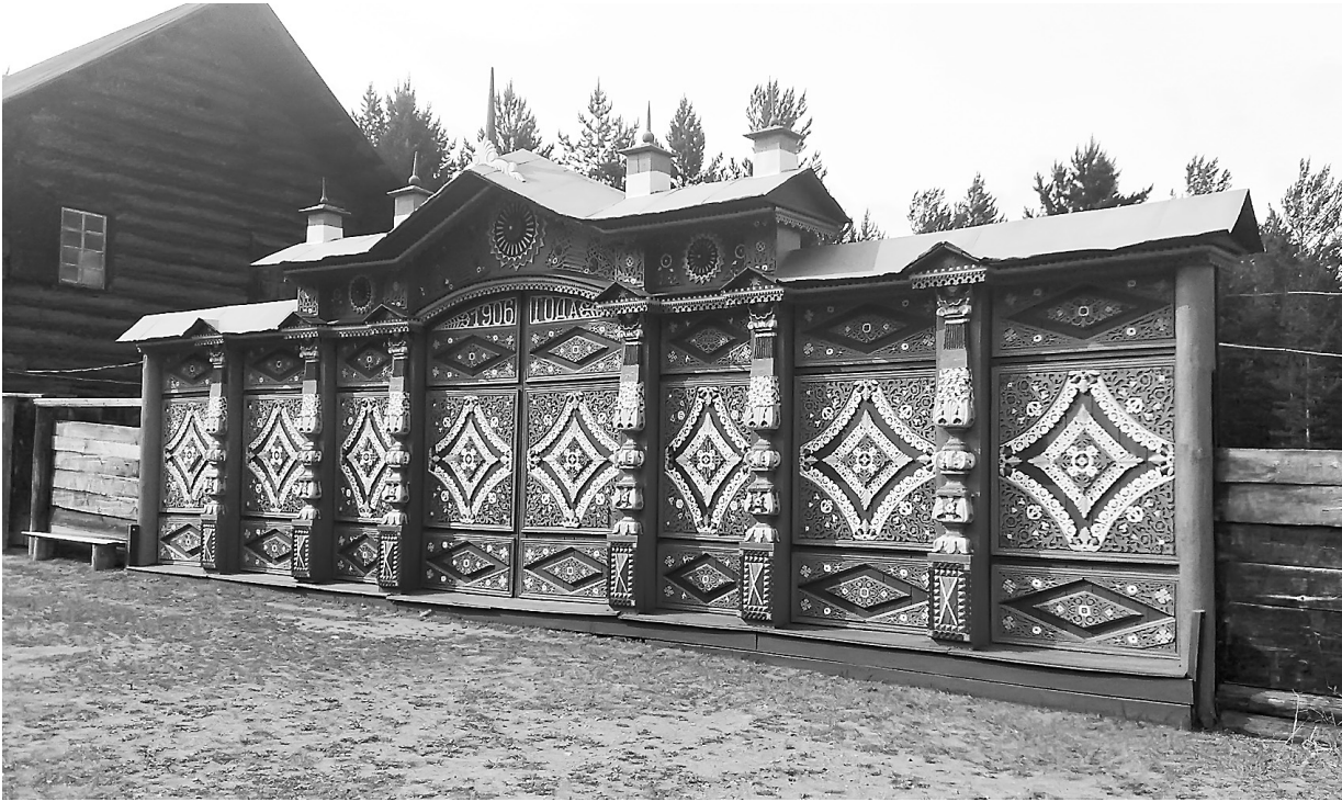
Ворота дома «семейских» в Этнографическом музее Улан-Удэ