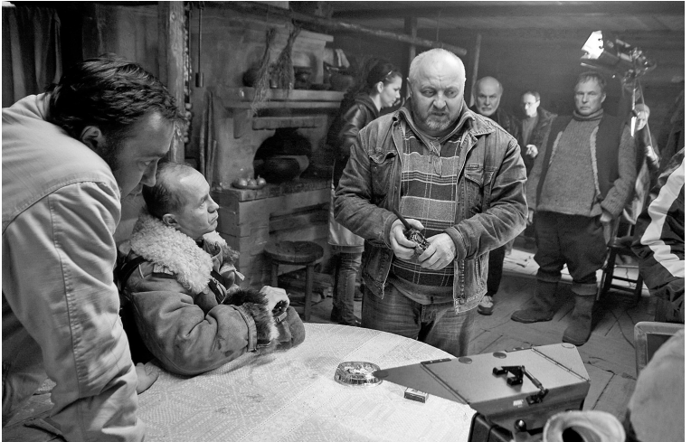
На съемках фильма «Волки»

Фильм не педалирует сталинскую тему. Репрессии в отношении бывших пленных – лишь фон, на котором разворачивается нравственная коллизия. И все же следует признать, «Волки» – практически первый в истории белорусского