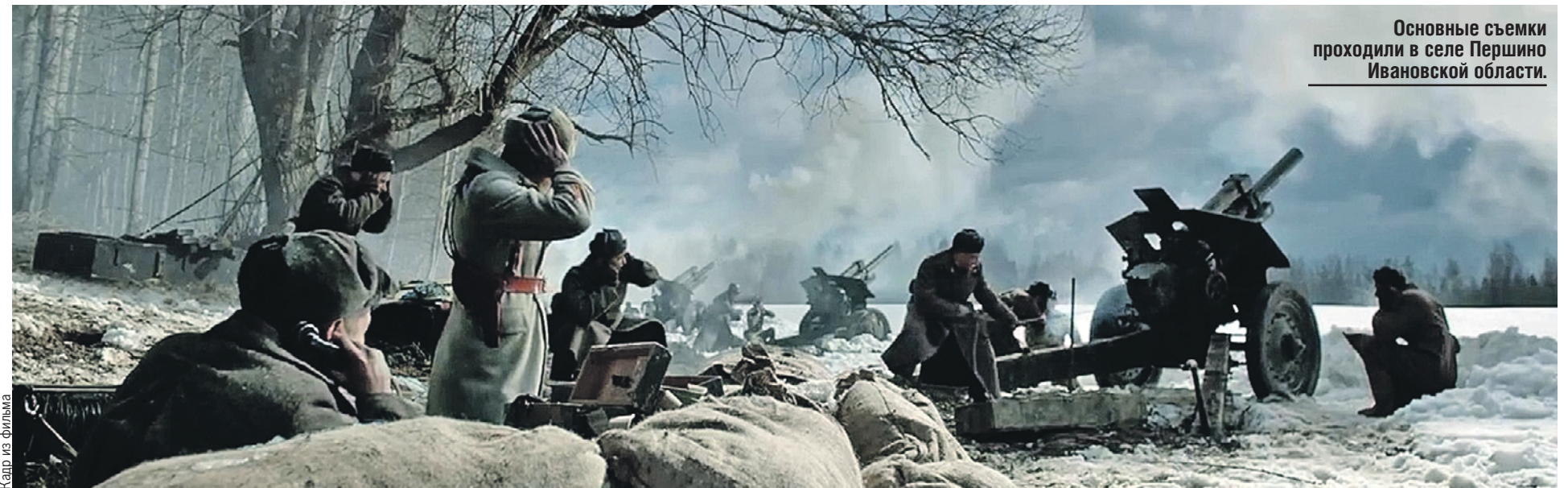
Основные съемки проходили в селе Першино Ивановской области.