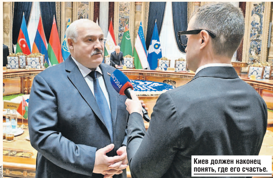
Киев должен наконец понять, где его счастье.

- Главная проблема во Владимире Зеленском. Думаю, что он все и понимает. Но вы же поймите и его положение - кем он будет, если он сделает - вот так, ни с того ни с сего, как он понимает, - эти шаги. Мне кажется, он склонен к тому, чтобы на него было со стороны мощнейшее давление, ну и тогда под этим давлением будут приняты соответствующие решения. Но действовать надо срочно. Россия продвигается на фронте. Я это говорю ответственно, поскольку каждый день это наблюдаю фактически. И это может привести к исчезновению Украины как государства. Хотелось бы, чтобы все-таки он услышал мои предложения и понял, что счастье ему на территории Украины никто не принесет, кроме славянских государств. Поэтому надо сесть и договориться.