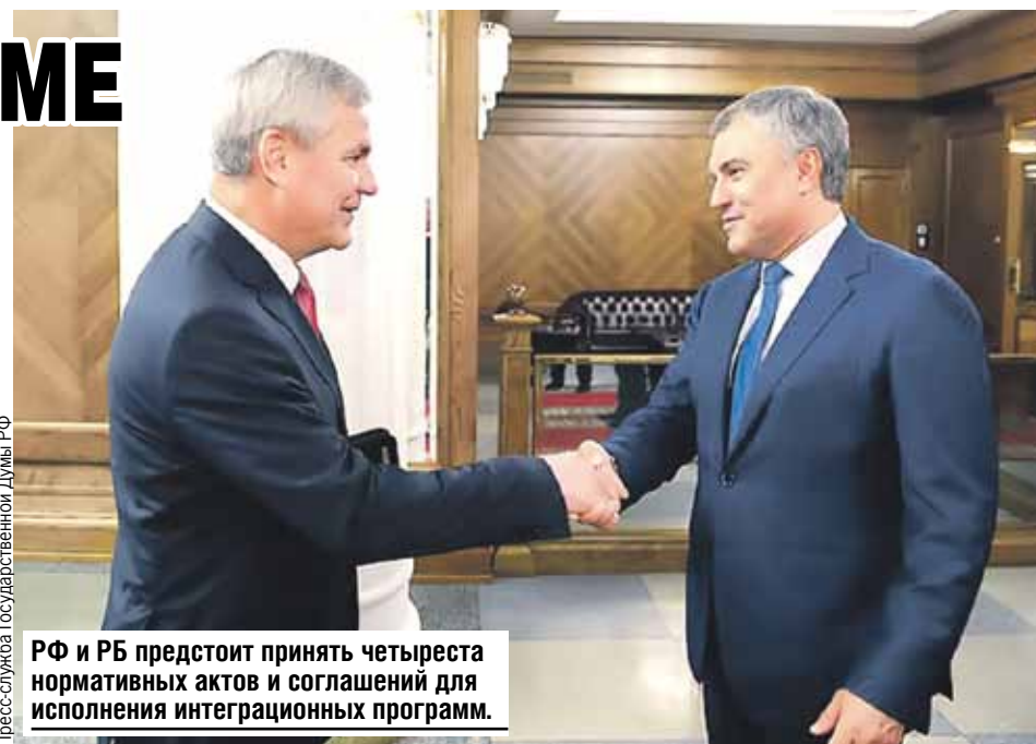
РФ и РБ предстоит принять четыреста нормативных актов и соглашений для исполнения интеграционных программ.

- Обсудим двойные стандарты со стороны европейских стран по отно-