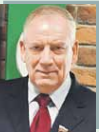
Виктор ПУСЕЙНОВ, kpmidia.ru

- Все мои коллеги из Совета Федерации и обеих палат белорусского парламента очень квалифицированные. Мы надеемся, что новый член