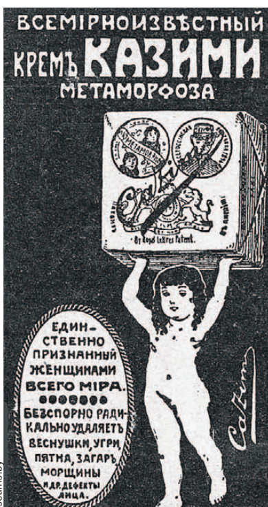
Баночку чудо-крема с такой этикеткой хотели получить все модницы.

Здание Горечковского историко-этнографического музея на улице Крупской - бывшая знаменитая аптека Казимира Паздзерского . На рубеже XIX - XX веков это имя было знакомо всем дамам высшего общества от Одессы и Вильнюса до Петербурга и Москвы. Каждая мечтала заполучить баночку с кремом «Казими-Метаморфоза», который выпускал Паздзерский. Секрет этого бьюти-хита в том, что он был «единственным в мире средством, избавляющим от веснушек». В 1900 году средство даже завоевало золотую медаль на Всемирной ярмарке красоты в Париже и покорило европейскую публику. Казимир продал больше двух миллионов баночек, сколотил на желании женщин иметь «идеально белое личико» приличное состояние и стал богатейшим человеком в Горках.