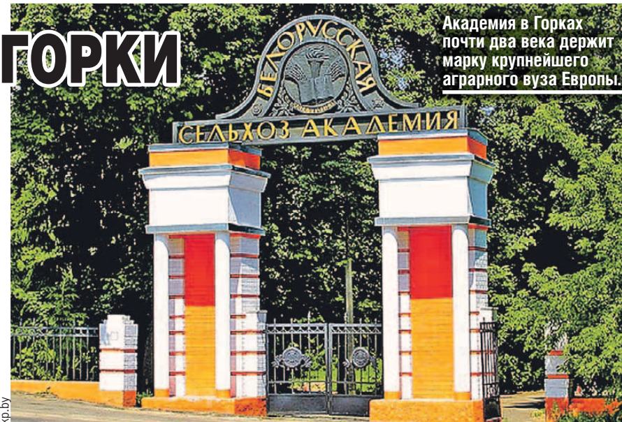
Академия в Горках почти два века держит марку крупнейшего аграрного вуза Европы.