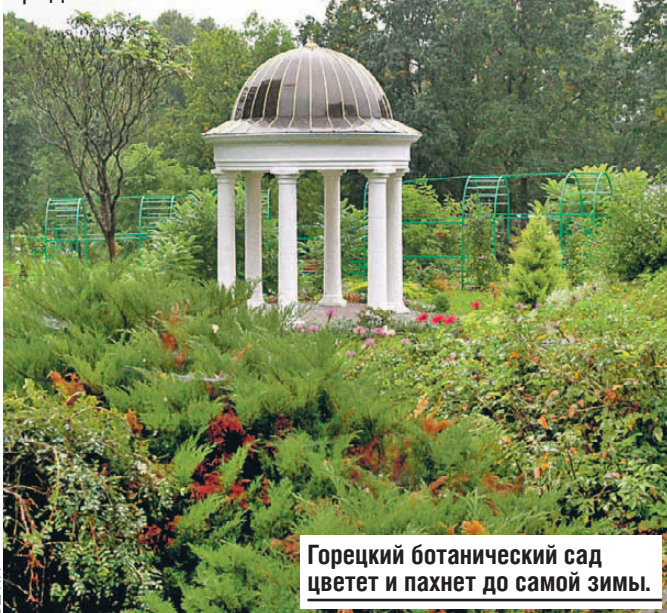
Горечковский ботанический сад цветет и пахнет до самой зимы.

Горечковский ботанический сад - настоящая гордость Беларуси. Основанный в далеком 1841 году, он развивается до сих пор. Первые хозяева - профессор Эдуард Рего и садовник Фелициан Тарновский - провели сотни исследований, результатами которых белорусские ученые пользуются и сейчас. Уже тогда коллекция исчислялась тысячами видов растений, а сад напоминал произведение искусства. В наши дни он ничуть не растерял своего очарования. Розарий, пионарий, прибрежные, вечнозеленые, краснокнижные и лекарственные растения. С ранней весны и до глубокой осени туристы едут полюбоваться неземными красками и надышаться пьянящими ароматами. Впечатляет своей масштабностью дендрарий: деревья с Дальнего Востока, из Северной Америки, Европы и Сибири, Крыма и Кавказа, Средней Азии.