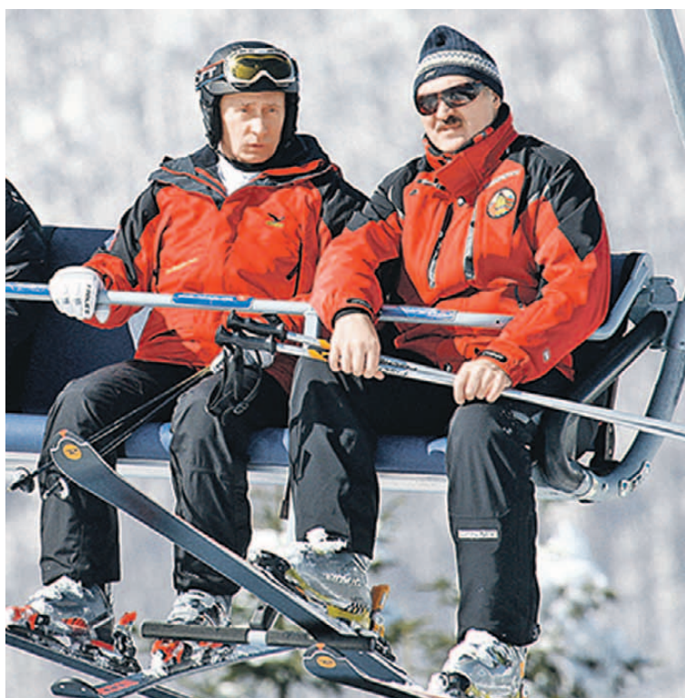
Иногда Владимир Путин и Александр Лукашенко проводят спортивный досуг вместе - например, катаются на горных лыжах в Красной Поляне.

травмы мениска. В молодости повредил. На скорости упал на левое колено во время игры. Делали операцию. Но бегать по полю было больно. Последний раз его видели на футбольных аренах в 2002 году - участвовал в товарищеской встрече футбольной команды ветеранов, открыл крытый футбольный манеж в Минске.