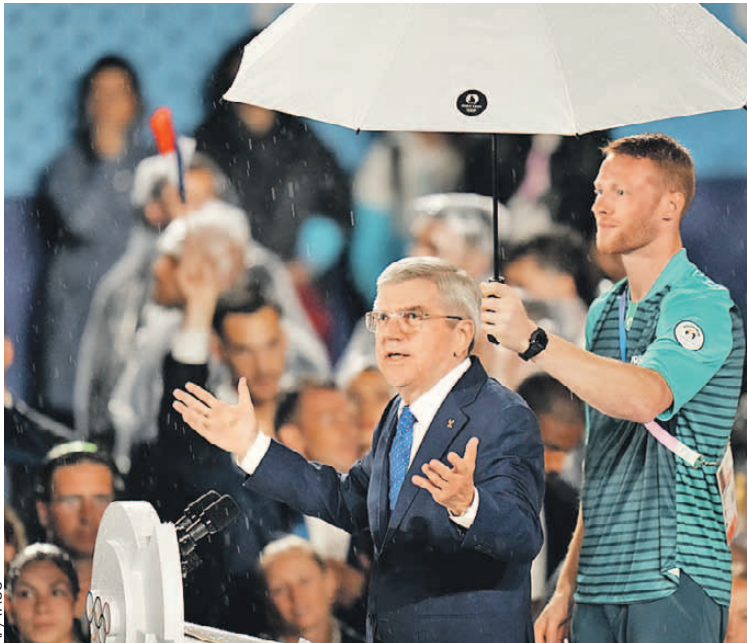
Каким бы зонтиком Бах ни прикрывался, от той гадости, в которую он окунул олимпийское движение, ему не спрятаться.

А его трансгендерные «шалости», когда мужики, по сути, крушили носы девушкам на олимпийском ринге в Париже, грозили уничтожить женский спорт как таковой. За эти половые эксперименты Баху, не исключено, придется