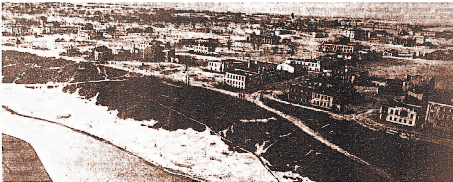
Город Ржев снят 4 марта с самолета.