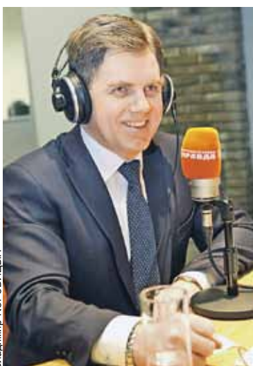
Во время прямого эфира на Радио «КП».

На долю России приходится около половины общего объема внешнего товарооборота Беларуси. Реализуется согласованная промышленная, аграрная политика. Есть совместные научные разработки, ряд союзных программ, которые позволяют