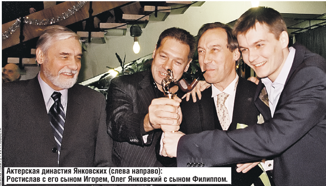
Галина КИМ/ТРИА Новости