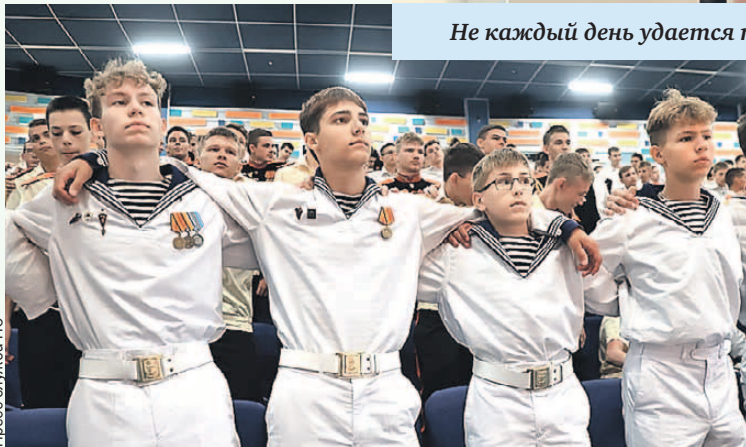
Не каждый день удастся пообщаться с Героем России.

ли мама и младшая сестренка. Мама укачивала маленькую. Вдруг к нам в дверь постучали. На пороге женщина, она взволнованно говорила: «У соседнего дома пожар, горит мусор». Я посмотрел в окно и увидел, что пожар занялся уже довольно сильный. Сразу побежал в ванную, набрал три тазика воды и пятилитровые бутылки, отнес их на улицу, стал звать