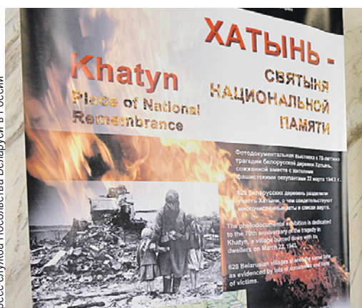
История деревни рассказана на восьми цветных плакатах.

Спектакль «Песняр» - это не пересказ биографии музыканта, а скорее фантазия на тему. Актеры показывают лишь последние месяцы жизни Мулявина, который в мае 2002 года попал в автокатастрофу и спустя