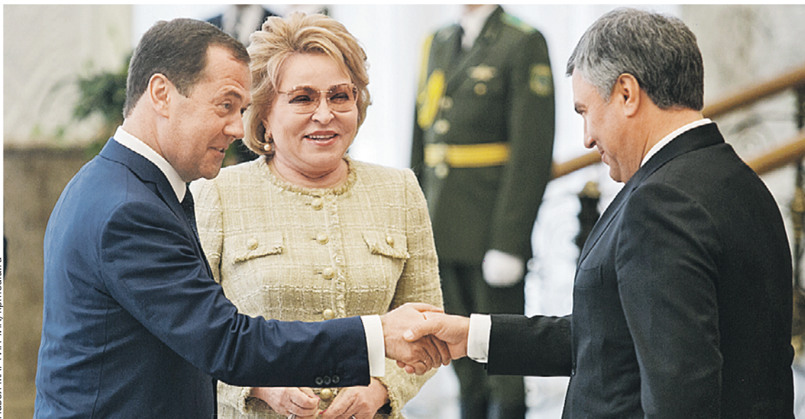
Премьер-министр РФ Дмитрий Медведев, глава Совфеда Валентина Матвиенко и спикер Госдумы и Парламентского Собрания Вячеслав Володин (слева направо) обсуждали вместе с белорусскими коллегами перспективы интеграции.

В последние четыре года, с тех пор как Россия после возвращения Крыма стала «изгоем» на Западе, а в отношении Беларуси, напротив, постепенно были сняты санкции и ограничения, роли наших стран на геополитиче-