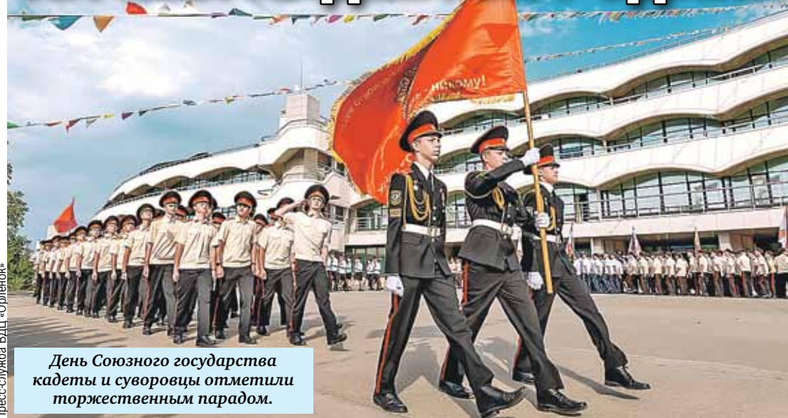
День Союзного государства кадеты и суворовцы отметили торжественным парадом.