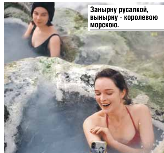
Заняв русалкой, вынырну - королевою морскою.

К тому же в диких бассейнах мужчины и женщины часто купались вместе голышом. Они находятся рядом с Провалом, недалеко от здания «Пироговских ванн». Температура воды - от 32 до 45 градусов, поэтому в ней можно находиться не больше десяти минут. Беременным, сердечникам и гипертоникам ванны не подходят. Всем остальным - добро пожаловать! Водичка и впрямь чудодейственная - исцеляет радикулит, избавляет от гинекологических заболеваний, лечит нервную систему и болезни кожи.