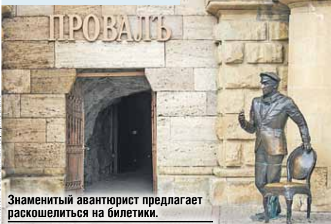
Знаменитый авантюрист предлагает раскошелиться на билетки.

В благодарность за рекламу местные жители установили у входа бронзового Остапа со стулом. Правда, у него в руках билеты не по пять и десять копеек, как в книге, а по пятьдесят. В гроте звучит музыкально-литературная композиция.