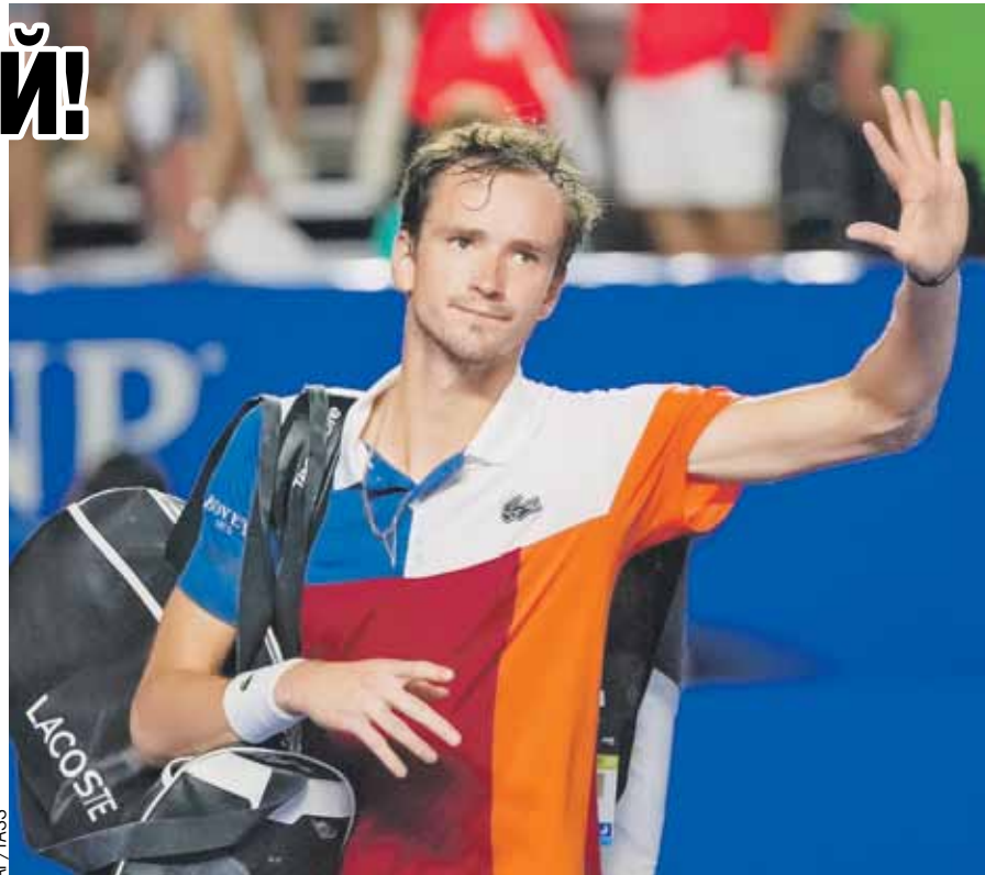
Отсутствию Даниила Медведева кто-то из западных спортсменов даже обрадовался. Теперь у них появился шанс на халяву проскочить в финал!

- Это полное безумство! - возмущается депутат Госдумы РФ, олимпийская чемпионка Светлана Журова. - Такие решения разжигают ненависть и дискриминацию. К сожалению, какие-то спортсмены из других стран, наверное, даже обрадуются: путь к финалу гораздо легче. Но насколько полноценным можно считать успех в турнире, куда по политическим мотивам не допустили сильнейших игроков?