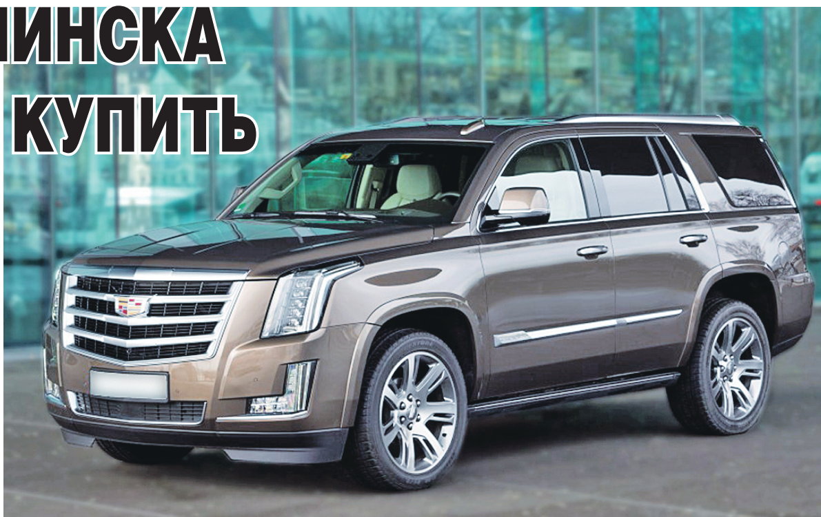
Вот так будет выглядеть минский кадиллак.

А совсем недавно, 9 июля, компании Chevrolet и Cadillac, также входящие в состав General Motors, объявили о подписании соглашений с «Юнисоном» о крупноузловой сборке своих самых дорогих внедорожников. Новый Chevrolet Tahoe четвертого поколения оснащается 6,2-литровым двигателем V8, стоит такой в России от 3 450 000 рублей. Люксовый Cadillac