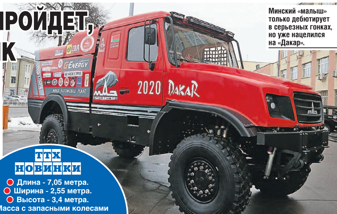
Минский «малыш» только дебютирует в серьезных гонках, но уже нацелился на «Дакар».

Особенно примечательно, что новый автомобиль спроектирован конструкторами минского завода. Бригада из восьми конструкторов колдовала над его обликом и начинкой больше четырех лет. И результат впечатляет своей необычностью. Например, смещение кабины в центральную часть позволило разгрузить передний мост, в итоге гонщики будут испытывать меньше вибрации, которая зверски выматывает