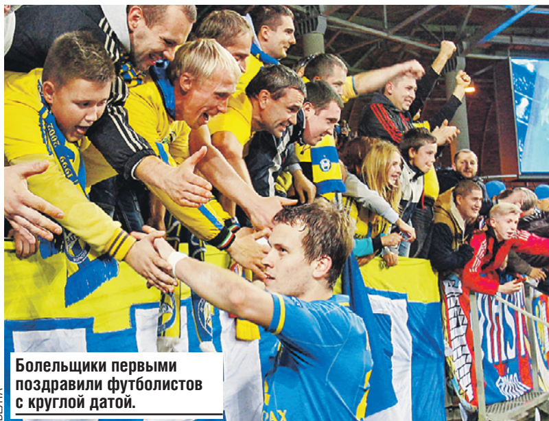
Болельщики первыми поздравили футболистов с круглой датой.

Команда шла на взлет по космической траектории. За годы, прошедшие после второго рождения, БАТЭ двенадцать раз становился чемпионом Беларуси. Причем последние десять лет