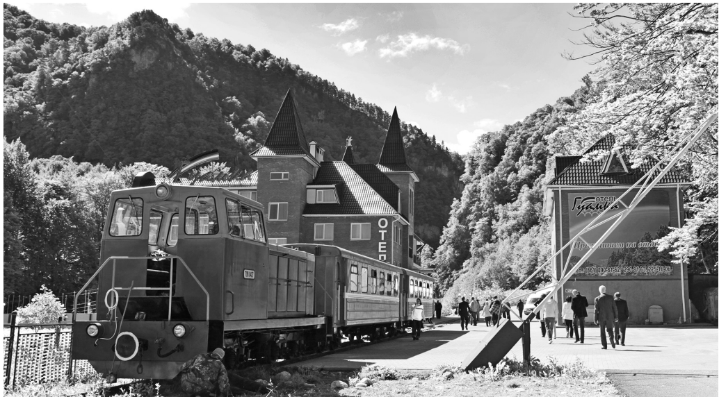
Туристический поезд в Гуамском ущелье в Краснодарском крае

этой системы присвоена самая высокая – первая категория. Всю необходимую информацию об отдыхе и лечении в белорусских санаториях в Беларуси, России и странах Прибалтики можно получить у специалистов республиканского унитарного предприятия «Центркурорт», отделения которого сегодня есть не только в городах республики, но и в Москве.