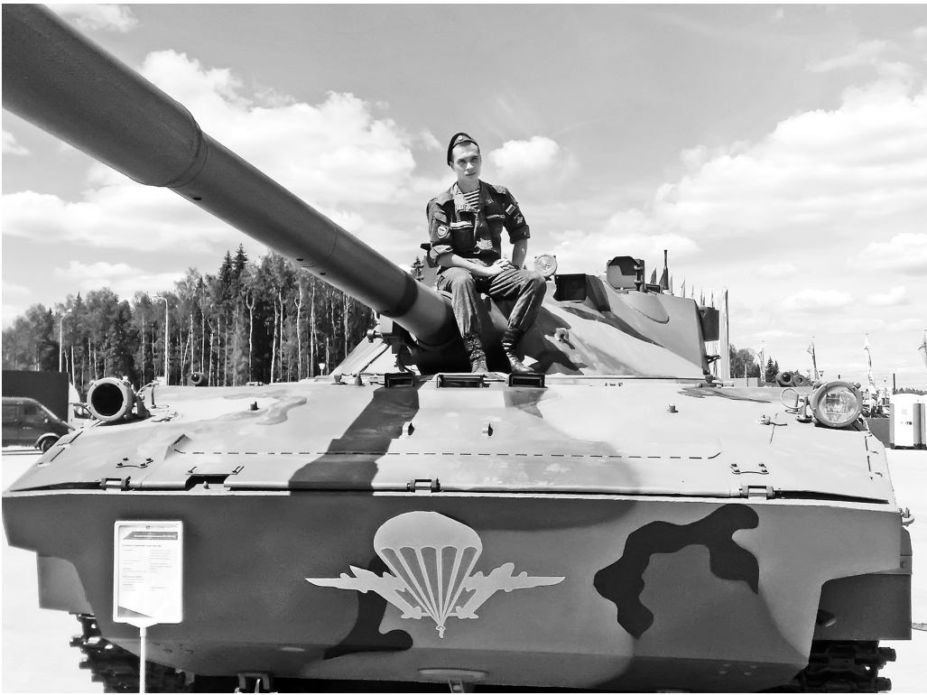
Самоходка «Спрут-СДМ1» с прицелом «Соколиный глаз»

Белорусский ВПК укрепляет сотрудничество с российским. Например, белорусское ОАО «Агат-системы управления» создало совместное предприятие с российским НПО «Квант», входящим в холдинг «Концерн Радиоэлектронные технологии». В задачи нового предприятия входит реализация опытно-конструкторских работ по модернизации и ремонту средств РЭБ. Кроме того, будет поставляться спецоборудование для производства, ремонта и техобслуживания средств РЭБ в интересах российской и белорусской армий. Недавно в Минске открыл представительство «Концерн РТИ Системы» – один из лидеров мирового рынка в области дальней радиолокации. Российская компания «Радиофизика», входящая в Концерн ПВО «Алмаз-Антей», купила на аукционе Государственного комитета по