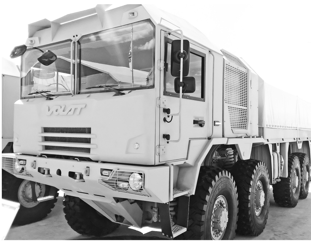
Грузовик компании «ВОЛАТ»

война совершенно нелегальна. В этой сфере Беларусь сегодня отчасти обошла Россию, а про другие страны постсоветского пространства и Восточной Европы нечего и говорить. В Кубинке 558-й АРЗ показал разведывательные БПЛА «Гриф-1» и