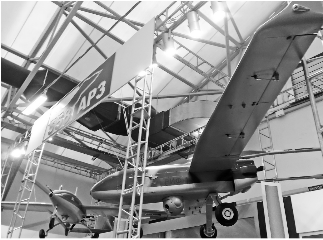
Беспилотник «Гриф-1» производства 558-й АРЗ

и в режиме программной перестройки рабочей частоты, что является исключительно сложной технической задачей (перестройка частоты для того и придумана, чтобы парировать работу средств РЭБ). Как сами средства РЭБ, так и шасси «Киви» изготовлены в Беларуси.