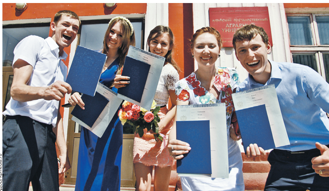
В России белорусам приходится сдавать ЕГЭ, а россиянам в Беларуси - ЦТ. Эксперты выступают за взаимное признание экзаменов.

Порадоваться можно за сферу культуры. Вопрос: как вы думаете, из какой страны нужно больше приглашать писателей, художников, артистов? Здесь опять же позитивная динамика