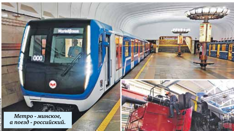
Метро - минское, а поезд - российский.