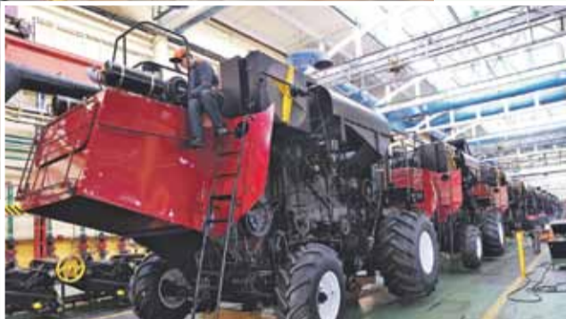
Раньше «Ростсельмаш» и «Гомсельмаш» были соперниками, а теперь стали союзниками.

Россия обсуждает приобретение около четырех тысяч белорусских автобусов для обновления своего автопарка. При этом регионы и так ежегодно активно закупают городской транспорт у сябров. Приобретают не только автобусы, но и электробусы, и трамваи, и троллейбусы. В обратном направлении в этом году последовали поезда из Мытищ для минской подземки. При этом внутри России тоже идет сборка городского транспорта из Синеокой. Так, в городе Ворсма Нижегородской области на совместном российско-белорусском заводе «Нижэко-