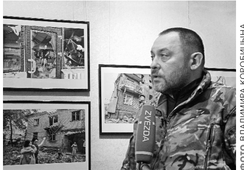
Фотограф Игорь ИВАНОВ, г. Донецк