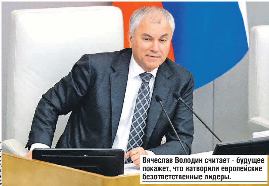
Вячеслав Володин считает - будущее покажет, что натворили европейские безответственные лидеры.