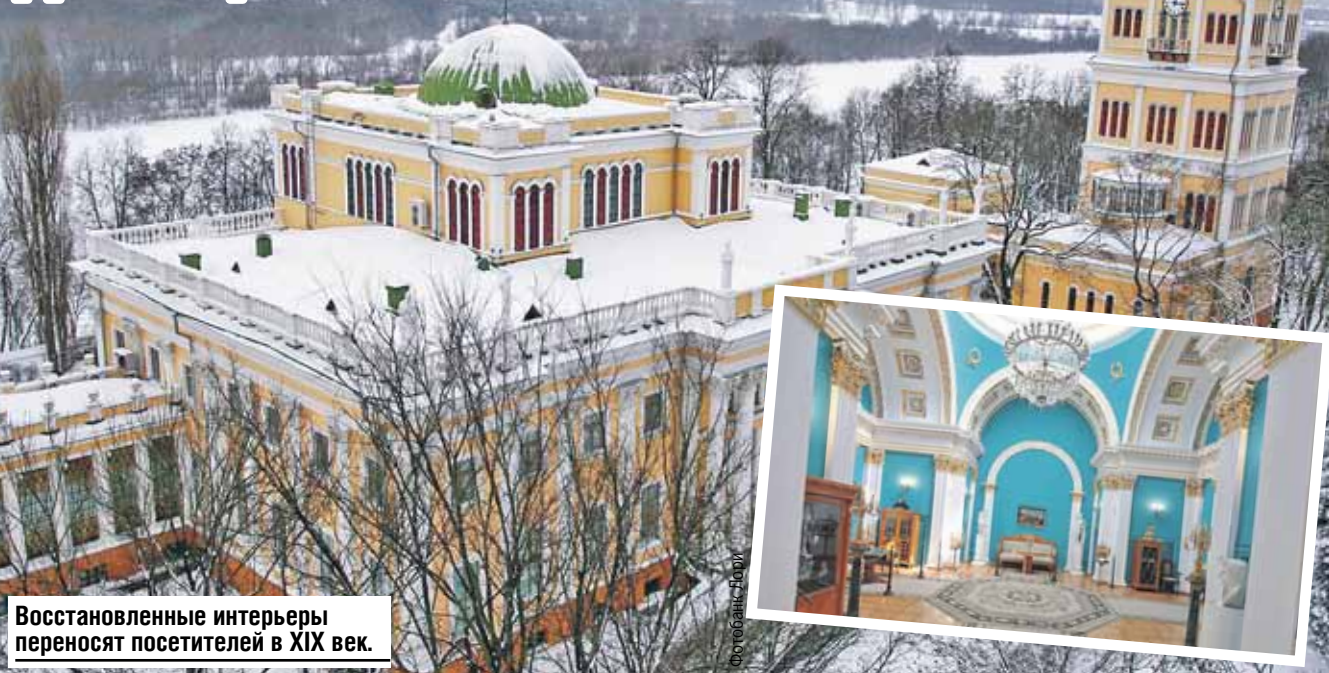
Восстановленные интерьеры переносят посетителей в XIX век.