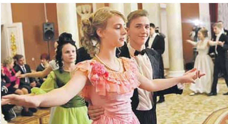
Атмосферу прошлого поддерживают не только особым дресс-кодом и танцами, но и знанием этикета.