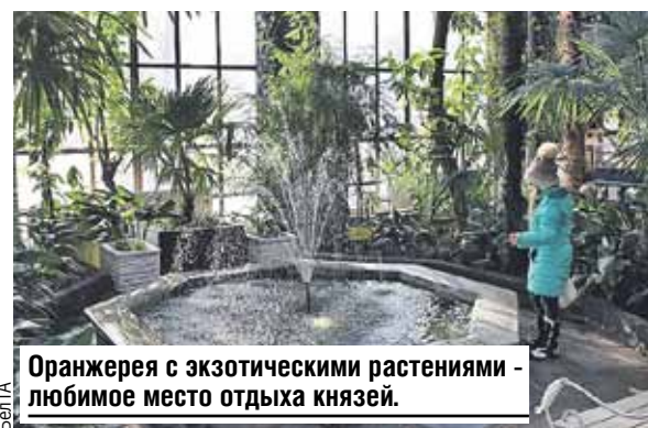
Оранжерея с экзотическими растениями - любимое место отдыха князей.

Понравится в Зимнем саду и детям: тут множество разноцветных аквариумных рыбок, пресноводных черепах, декоративных кроликов и морских свинок.