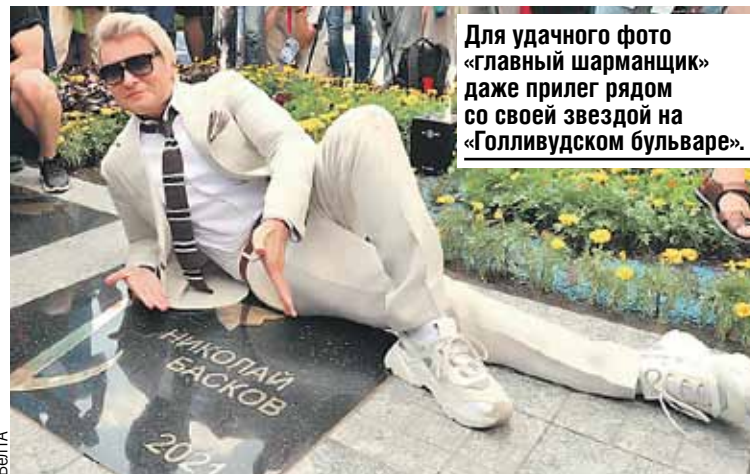
Для удачного фото «главный шарманщик» даже прилег рядом со своей звездой на «Голливудском бульваре».