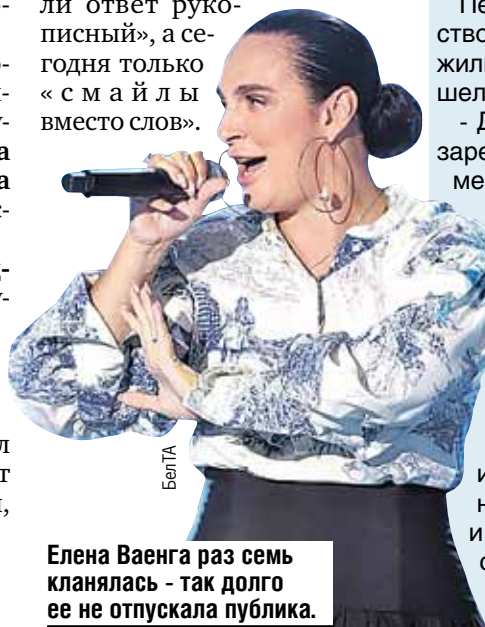
Елена Ваенга раз семь кланялась - так долго ее не отпускала публика.

Анатолий Ярмоленко спел потрясающую песню про то, что до зарплаты «рублем выручали», «неделями ждали ответ рукописный», а сегодня только «с м а й л ы вместо слов».