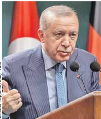
Даже воинственный Эрдоган поразился кровожадности Нетаньяху.

Ядерное оружие не появится в Иране никогда.