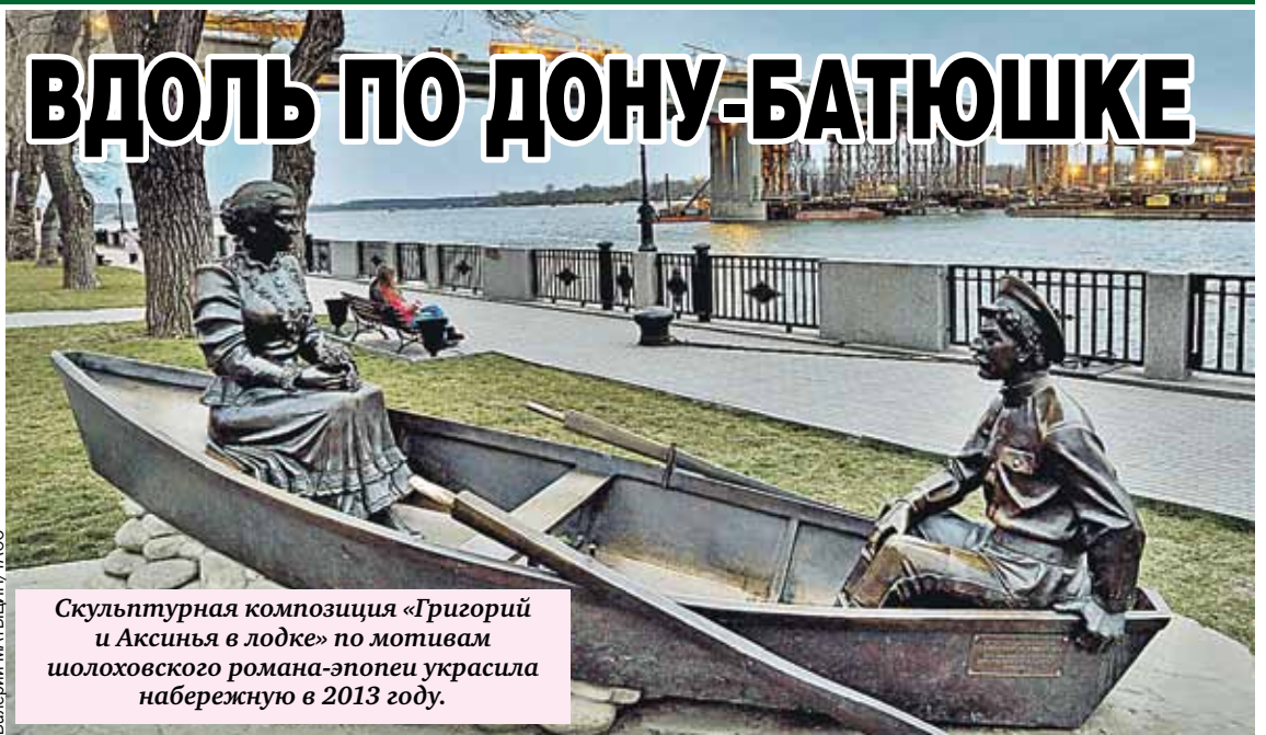
Скульптурная композиция «Григорий и Аксинья в лодке» по мотивам шолоховского романа-эпопеи украсила набережную в 2013 году.

Памятник знаменитой тачанке - монументальная визитка