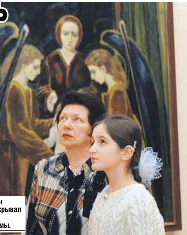
В своих работах он экспрессивно раскрывал исторические и современные темы.

«Я приверженец направления, которое называется соцреализм, - до последнего подчеркивал