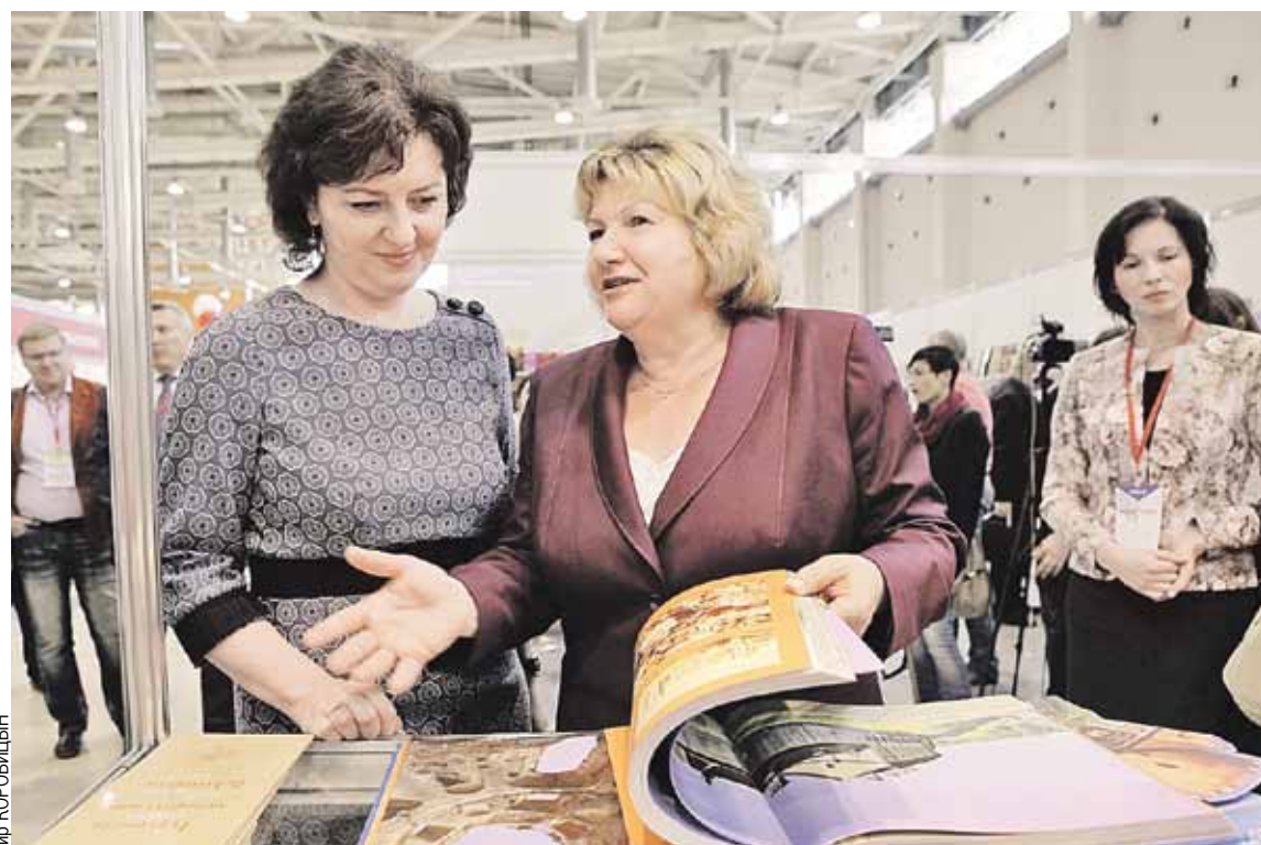
Министр информации Республики Беларусь Лилия Ананич показывает первому заместителю главы Департамента СМИ и рекламы Москвы Юлии Казаковой одну из главных новинок - альбом «Беларусь замковая».