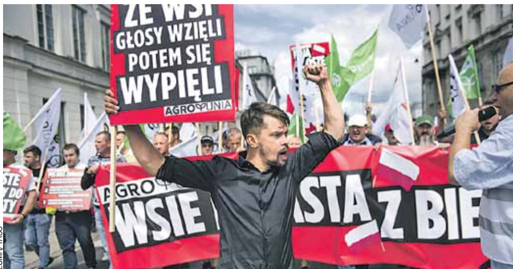
Во всей Европе фермеры протестуют против высоких затрат на сельхозпроизводство. Они считают, что их вынудили платить за решения политиков.

Хронология развития кризиса здесь стандартная. Чем выше ставки, тем мень-