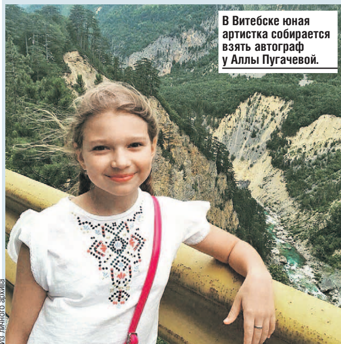
В Витебске юная артистка собирается взять автограф у Аллы Пугачевой.