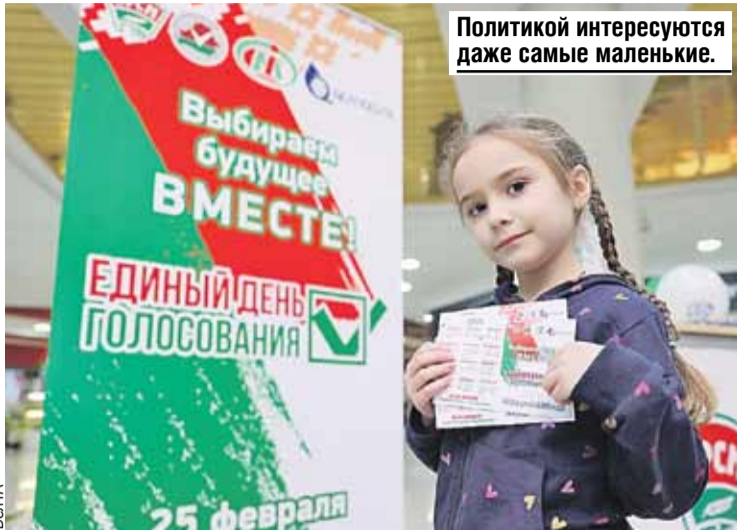
Политикой интересуются даже самые маленькие.

- Главные причины - отсутствие необходимых мер безопасности в других государствах, сокращение численности работников