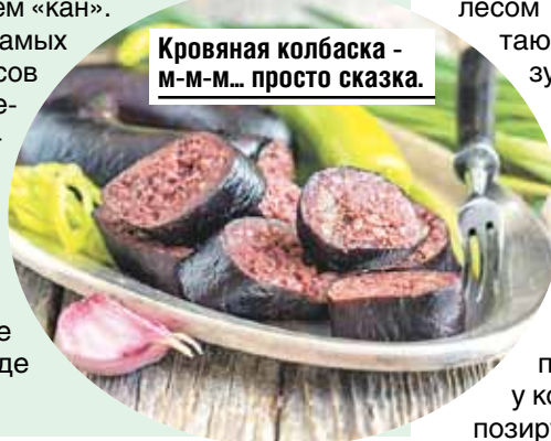
Кровяная колбаска - м-м-м... просто сказка.

Есть и варианты размещения попроще - трехзвездочный отель и небольшие гостевые дома. Везде очень атмосферно!