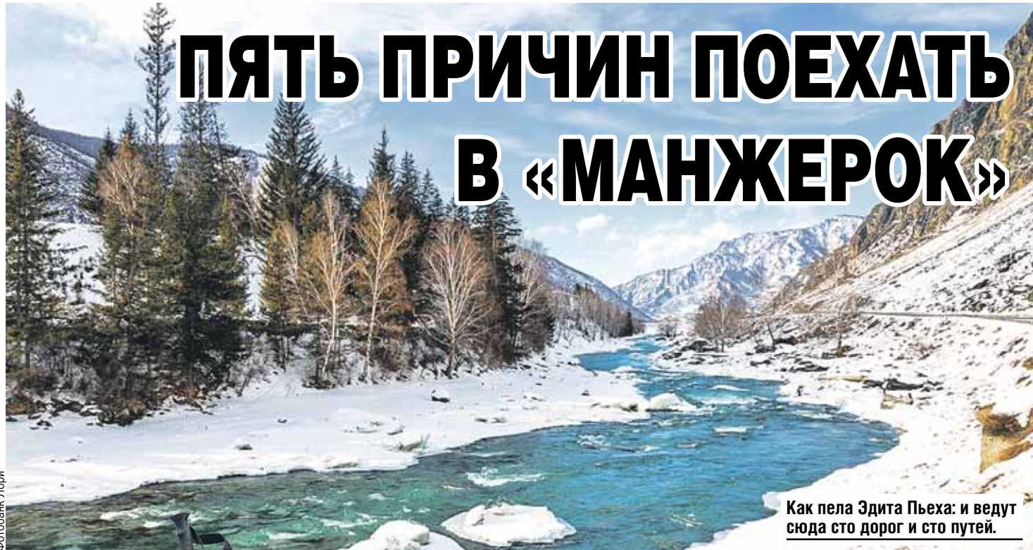
Как пела Эдита Пьеха: и ведут сюда сто дорог и сто путей.