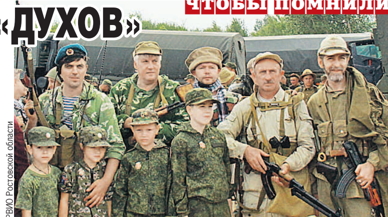
Военно-историческое общество большое внимание уделяет патриотическому воспитанию детей.

После скоротечного боя разведчики заняли господствующую высоту. Следом по проверенной территории проехала наша БМП. Чуть позже появил-