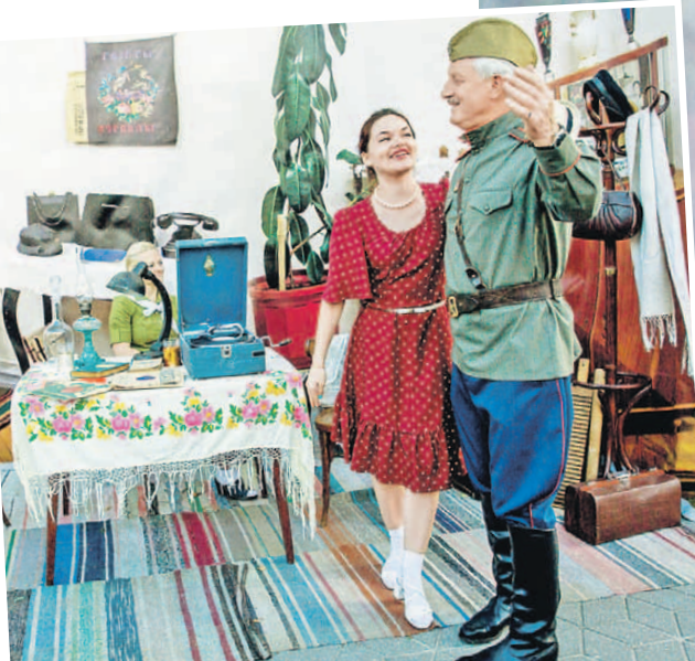
День накануне войны в Бресте: субботний вечер, патефон, танцы. Совсем как в песне Иосифа Кобзона: «Мирное небо... счастливые лица... все еще живы».