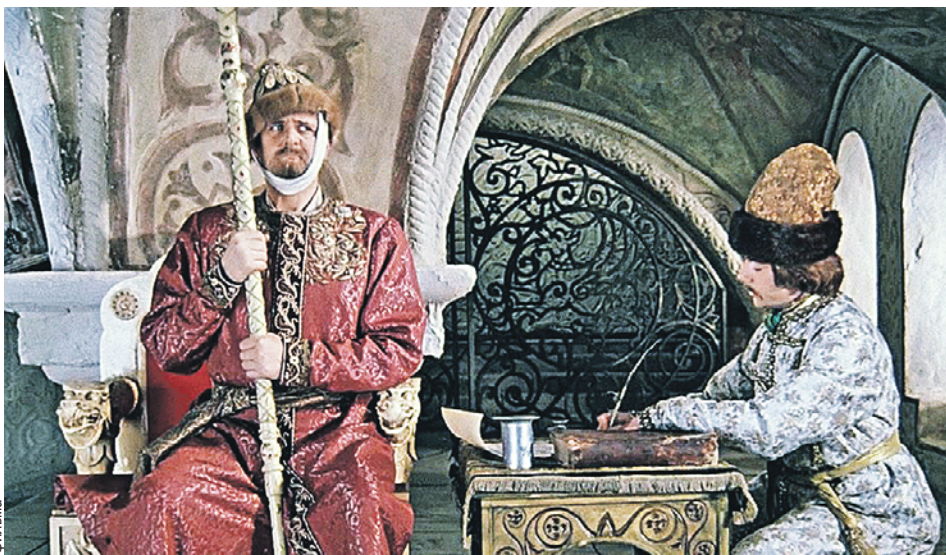
«А куда это Федя запропастился?» Царские палаты в комедии «Иван Васильевич меняет профессию» снимали в Ростовском кремле.

В поселке Семибратово есть «Библиотека варенья». На полках - собрания сочинений в пузатеньких баночках, от традиционного ежевичного до варенья из еловых шишек. Варенье из черники и морошки - «Лесные мемуары», а вишневое и дынное входят в двухтомник «Курортный роман». Для гурманов - мазюня из редьки.