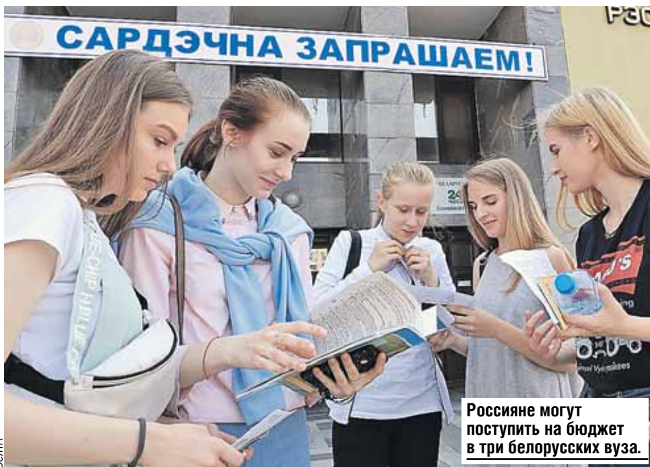
Россияне могут поступить на бюджет в три белорусских вуза.