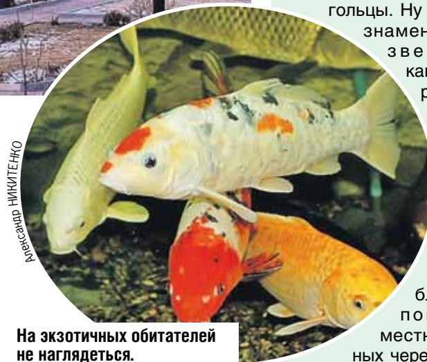
На экзотических обитателей не наглядеться.

На утесе устроили смотровую площадку, откуда открываются великолепные виды. Популярное у влюбленных парочек развлечение - смотреть с высоты на закат и проплывающие мимо теплоходы и лодочки. Прижилась традиция - молодожены высаживают в ближнем парке саженцы деревьев. А если ваш визит выпал на праздни-