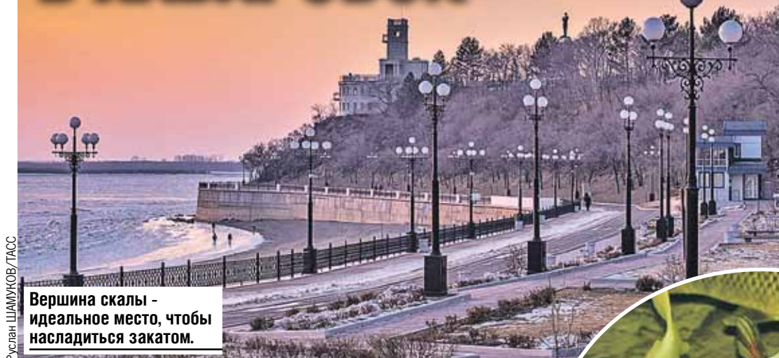
Вершина скалы - идеальное место, чтобы насладиться закатом.