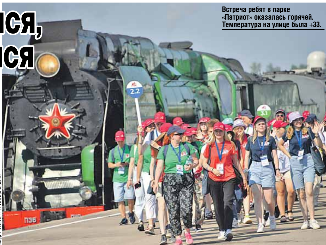
Встреча ребят в парке «Патриот» оказалась горячей. Температура на улице была +33.

Экспонаты трогать можно. Двое делают селфи в дуле 540-метровой самоходной немецкой мортиры по прозвищу «Адам» - главного трофея музея. Эта железная машина высотой с двухэтажный дом никогда не воевала, а вот ее родственник (у них были в основном женские имена) применяли при штурме Брестской крепости и осаде Севастополя. Но их эффективность не соответство-