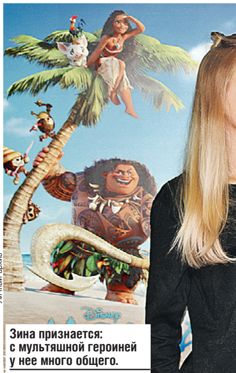
Зина признается: с мультяшной героиней у нее много общего.

■ Главную героиню диснеевского мультлика «Моана», который выйдет в прокат 1 декабря, озвучила 14-летняя минчанка.