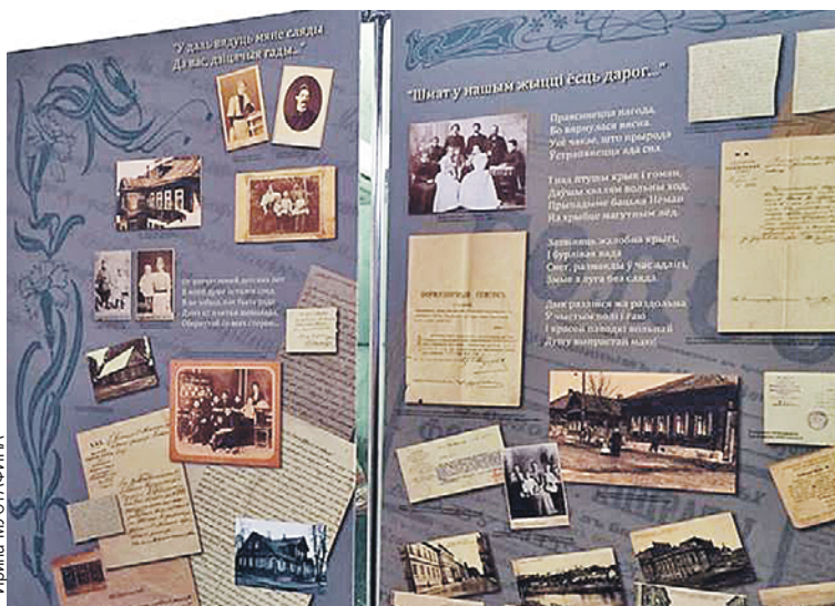
Больше сотни фотографий привезли из Литературного музея поэта в Минск.