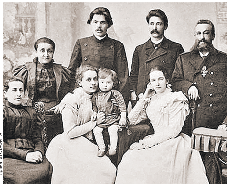
Пешковы и Богдановичи: в Нижнем Новгороде Максим Горький (Пешков - настоящая фамилия) и отец писателя женились на сестрах Волжиных.

Целая серия фотографий на выставке - нижегородского периода. Там семья Богдановичей познакомилась