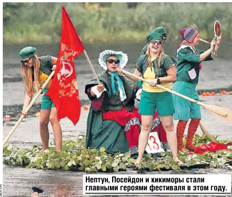
Нептун, Посейдон и кикиморы стали главными героями фестиваля в этом году.

До главных достопримечательностей города идти не нужно - можно подплыть. Например, к знаменитому Туровскому лугу, где по весне и осени останавливаются и гнездятся сотни тысяч птиц. Бердвотчеры со всего мира специально приезжают на уникальное зрелище. Среди краснокнижных обитателей - шилохвость, кулик-сорока, малая чайка, галстучник. Правит пернатым балом кулик-мордунка, у которого в Турове самое крупное поселение.